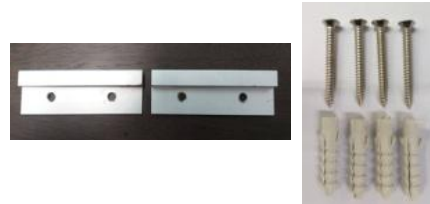
ชุดอุปกรณ์ติดตั้งกระจกเงา