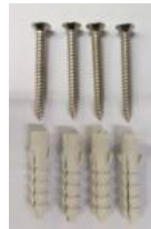
ชุดอุปกรณ์ติดตั้งกระจกเงา